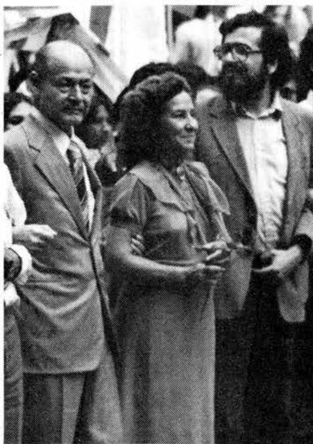
Aníbal Yáñez/Perspectiva Mundial

“Este pueblo que admira la revolución cubana, este pueblo que ve con gusto y con orgullo la revolución en Nicaragua, y que quisiera que avanzara la revolución de El