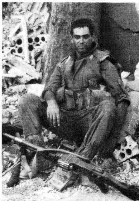
Para los trabajadores israelíes el sionismo sólo ofrece más guerra.

En El Salvador, por ejemplo, fue Israel el que dotó de armamentos a la dictadura militar antes de 1979; en ese entonces no le convenía a Washington estar asociado