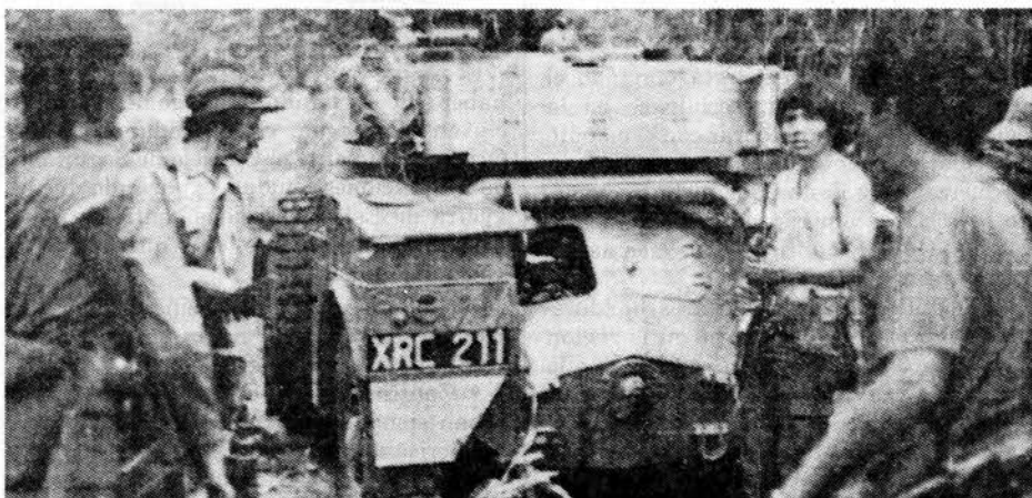
Vehículo blindado capturado por las fuerzas del FMLN cerca del volcán Guazapa en febrero.

Pero a pesar de la envergadura de la ofensiva del gobierno, informó el semanario Newsweek del 28 de junio, después de "una larga semana de lucha sangrienta e inconclusa, el ejército exhausto se retiró" de Chalatenango. "Observadores dijeron