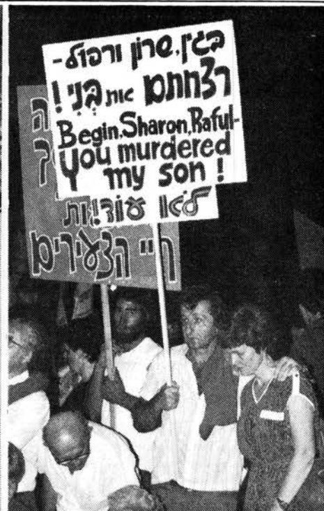
Cientos de tanques en camino a Beirut preparando el asalto a la ciudad. Manifestantes antiguerra en Israel: 'Begin, mataste a mi hijo'.