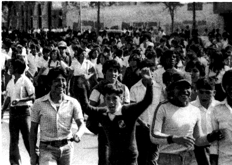
Parte de la marcha de 5000 estudiantes de primaria y secundaria en Lima el 8 de noviembre protestando alzas en los pasajes.

Además de la derogación del alza de pasajes, los estudiantes también han pro-