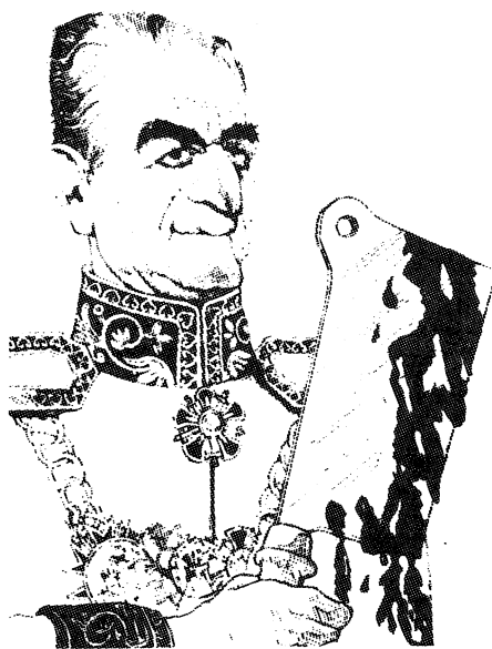
SHA MOHAMMED REZA PAHLAVI: Las masas iraníes rechazan la monarquía constitucional, que preservaría en el poder al tirano verdugo apoyado por Washington.

miento en contra del sha, presentándolo como el fruto del trabajo de fanáticos religiosos. Pero después de las protestas más recientes, incluso la prensa burguesa