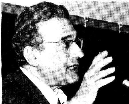
ERNEST MANDEL

La siguiente es un extracto de la respuesta de Mandel.