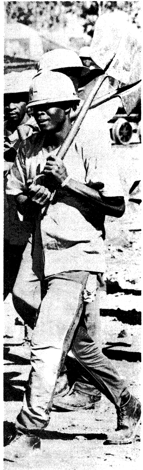
La clase obrera africana en marcha.

A pesar de toda la ayuda que recibieron, las fuerza somalíes fracasaron en su in-