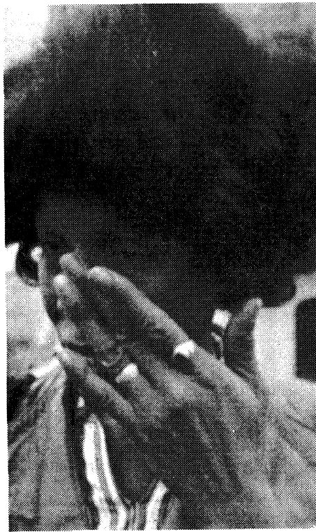
Una mujer llora por la muerte de una de las víctimas en Jonestown.

unieron a este culto en particular creían, aún cuando erróneamente, que luchaba por la justicia social.