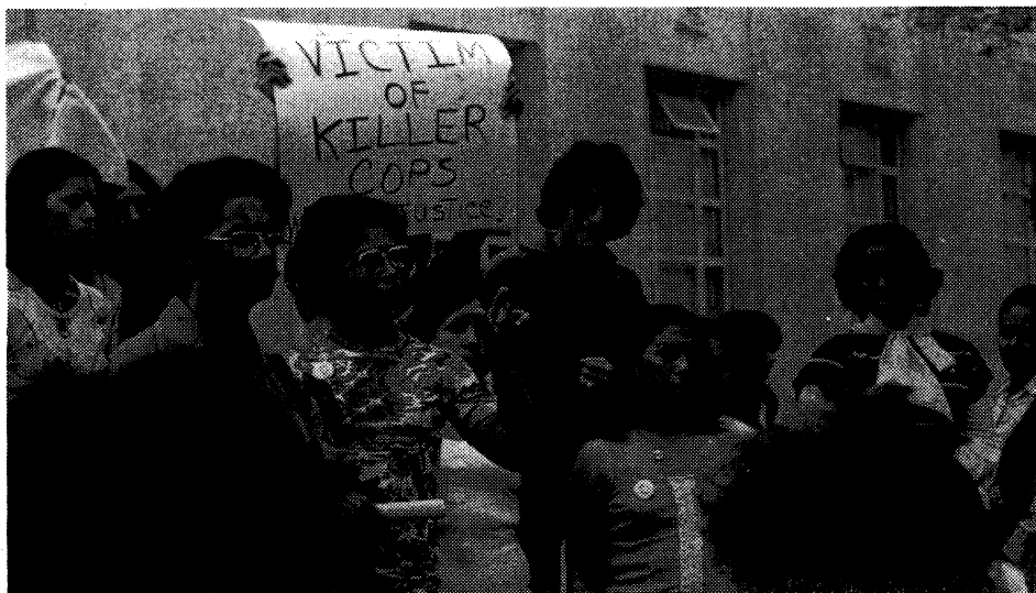
Protesta en Houston contra la justicia capitalista.

*Esta rebelión de prisioneros en su mayoría negros y puertorriqueños tuvo claros matices políticos. Iba dirigida en gran parte contra el racismo y la opresión intolerable del sistema penal capitalista. El levantamiento fue aplastado en forma sangrienta con un tremendo despliegue de fuerza por el entonces gobernador de Nueva York, Nelson Rockefeller. Fueron muertos por lo menos 28 prisioneros.