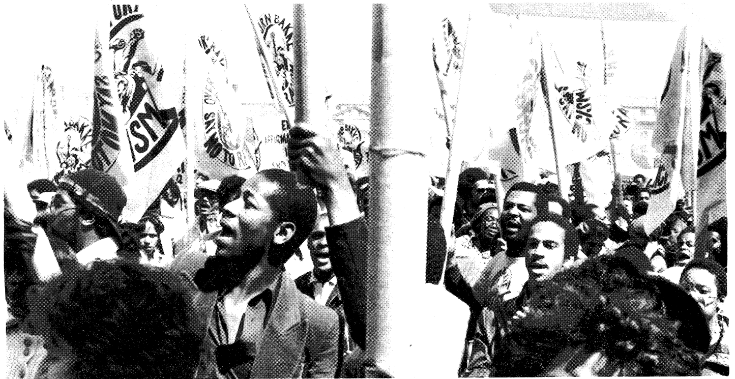
Roberto Flores/Perspectiva Mundial

WASHINGTON, D.C., 15 de abril: Por lo menos diez mil manifestantes protestaron hoy contra el fallo Bakke en esta ciudad. Vitoreando consignas como "Igualdad sí, racismo no" y "Venceremos", la protesta dejó bien