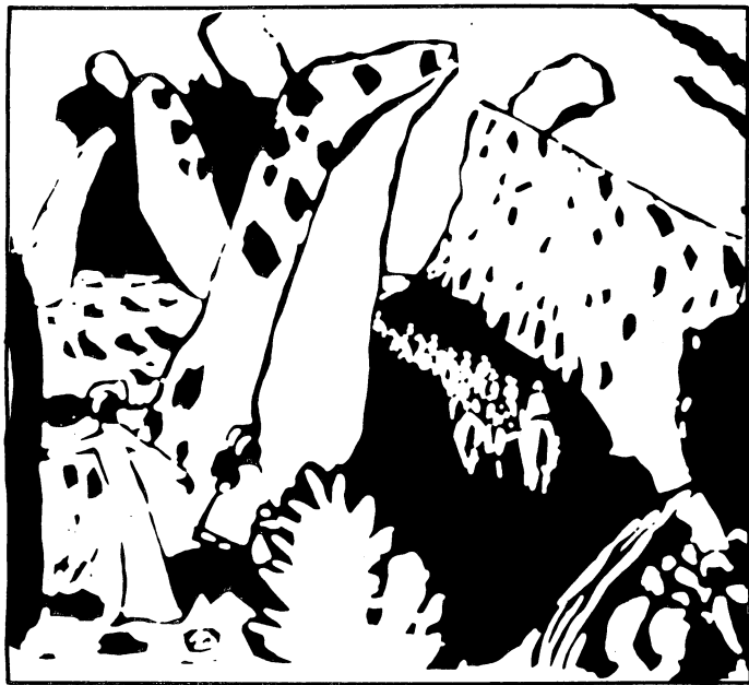
Basilio Kandinsky. Composición. 1911.

R. Eso es interesante porque cuando comenzaron las exposiciones de arte moderno, las bienales, los países llamados socialistas comenzaron a participar en esas asociaciones internacionales de críticos de arte, de las que yo fui parte —en las bienales, en las grandes manifestaciones de arte internacional. Al principio había inmediatamente una imposición de orden por parte de las autoridades para que los artistas siguieran la línea, digamos, del arte social, del realismo socialista. Poco a poco, con el desarrollo de las organizaciones internacionales, con el éxito que tenían incluso en los países llamados socialistas, los responsables del arte en esos países no se sentían con fuerza para impedir que los artistas de sus países pasaran a crear con libertad como en los países capitalistas del occidente. Yo vi en Polonia, en Checoslovaquia, a artistas nuevos, jóvenes que eran mandados a las bienales pero que no tenían el beneplácito de los dirigentes. Una vez fui invitado a una especie de exposición, digamos clandestina, de algunos artistas nuevos de Checoslovaquia, antes de la Primavera de Praga. Había una tendencia a capitular ante la alta burocracia, esto en el plano cultural. Y ellos llevaban al extremo el arte occidental, muchos comenzaron a producir arte moderno. Hasta en Rusia había eso, por ejemplo, arte abstracto.