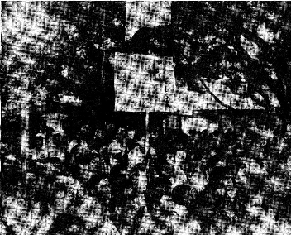
Liga Socialista Revolucionaria

Los trotskistas panameños manifiestan contra las bases yanquis.