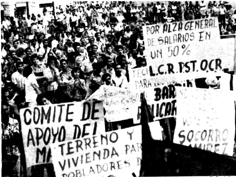
Manifestación de apoyo a la campaña de Socorro Ramírez.