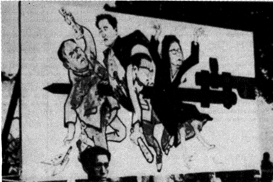
La "banda de los cuatro".