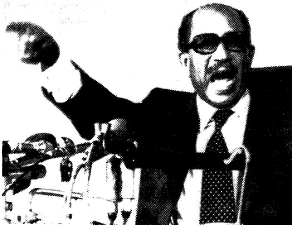
Sadat hablando ante una sesión de emergencia del parlamento egipcio.

La imagen del Presidente Jimmy Carter como "pacificador" recibió un rudo golpe el 17 de enero cuando el Presidente Sadat, le ordenó a la delegación egipcia discontinuar las negociaciones en Jerusalén y regresar al Cairo.