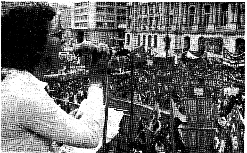
El Socialista Socorro Ramírez dirigiéndose a multitudes de estudiantes, trabajadores y mujeres que reciben entusiasmadas el mensaje del socialismo.

Se presenta también la lucha contra el proyecto de la constituyente y contra el régimen bipartidista liberal-conservador y