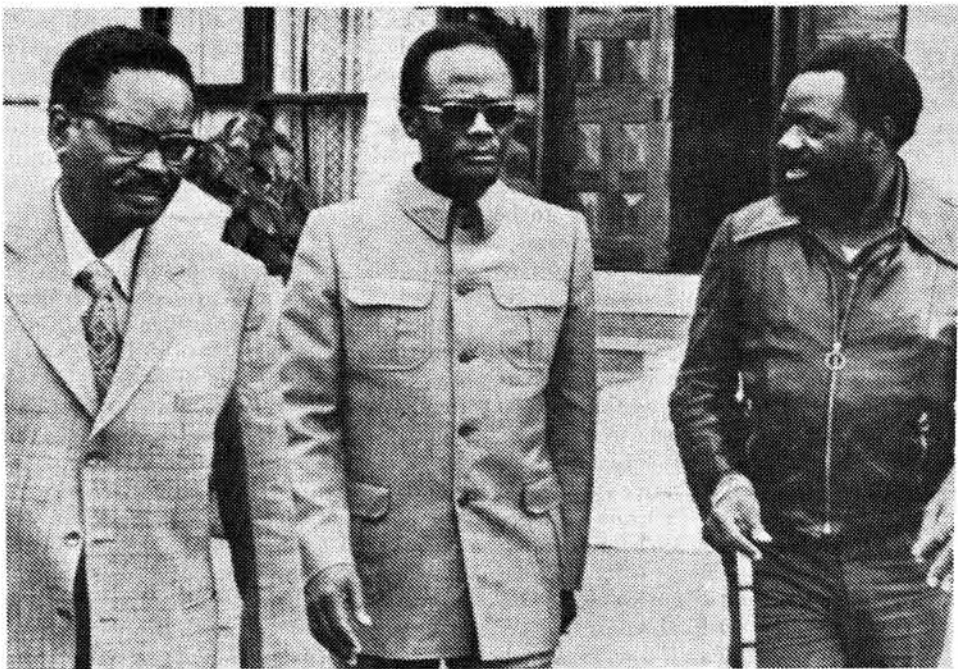
Christian Science Monitor

"Even Portuguese who do not like the MPLA's leftist leanings admit that the MPLA is establishing disciplined control in