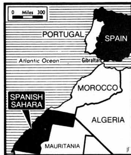
Christian Science Monitor

As part of his bid to seize control of Spanish-ruled Sahara, King Hassan II of Morocco declared October 16 that he would lead a march of 350,000 Moroccans into the phosphate-rich desert territory in order to claim it for Morocco. The march appears to be aimed at heading off a referendum, proposed by Franco, in which residents of