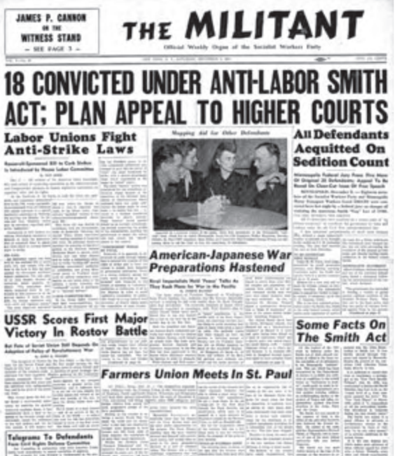
Arriba, los acusados James P. Cannon, derecha, y Farrell Dobbs, en Minneapolis, 1941. La edición del Militant del 6 de diciembre de ese año informa sobre su condena y la de 16 otros dirigentes comunistas y del sindicato Teamsters bajo cargos de “conspiración”.