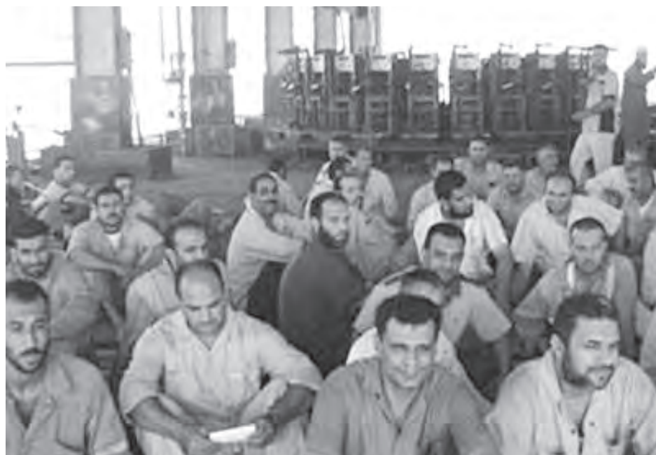
Obreros textiles en Mahalla, Egipto, protestan el 26 de agosto para exigir pago de bono prometido. “Nuestra revolución es contra el hambre, la pobreza y el nepotismo” coreaban.

Firmes tras ataques del ejército a islamistas