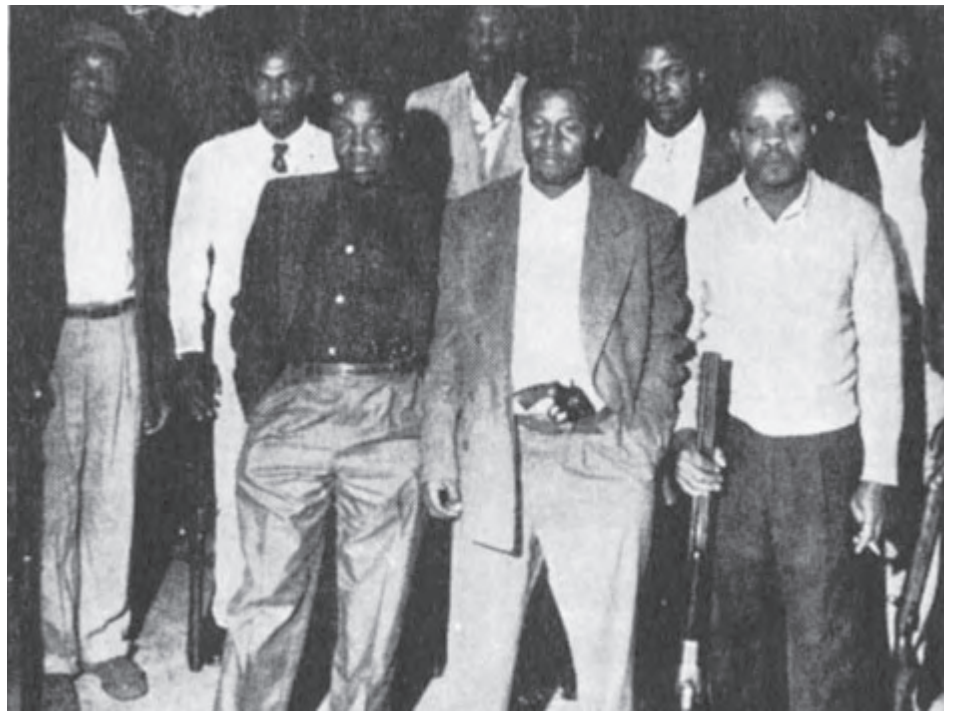
Lucha por derechos de los negros fue en contra del poder estatal capitalista, sus leyes, policía, cortes y políticos. Arriba, miembros del NAACP en Carolina del Norte, se armaron en la década de los 50 y lograron frenar el terror del Ku Klux Klan. Libro de Pinker promueve mentira que declive de racismo y violencia es resultado del proceso “civilizador del capitalismo moderno”.

mundiales como casualidades de la historia, rechazando la posibilidad de que se de otra guerra entre las potencias imperialistas. Ve el crecimiento de “organizaciones intergubernamentales” tales como Naciones Unidas y la Unión Europea como factores que limitan el riesgo de una guerra.