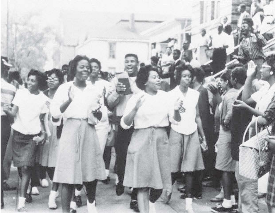
Birmingham, mayo de 1963: Jóvenes marchan listos a enfrentarse a los perros de policía y a las mangueras de agua de alta presión del gobierno municipal segregacionista. La Batalla de Birmingham, que duró cinco semanas, fue un hito en el movimiento por los derechos civiles.

Igualdad Racial encabezó los Freedom Rides [Viajes por la Libertad]. Para enfrentar los brutales ataques racistas de pandillas del Ku Klux Klan, se enviaron al sur autobuses de luchadores por los derechos civiles, tanto negros como blancos para desafiar la segregación en los autobuses interestatales.