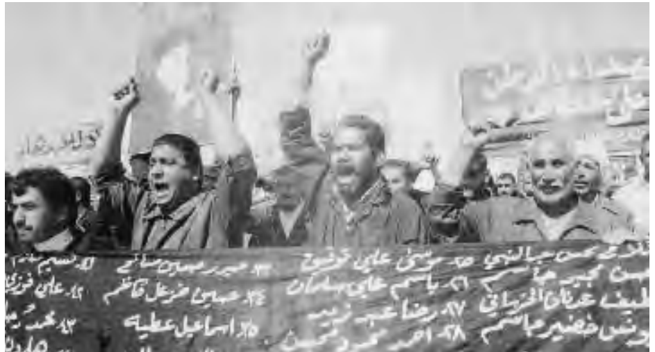
Cientos de trabajadores de la industria eléctrica marchan en Bagdad el 24 de marzo para condenar los ataques de grupos vinculados al antiguo régimen de Saddam Hussein contra centrales eléctricas.