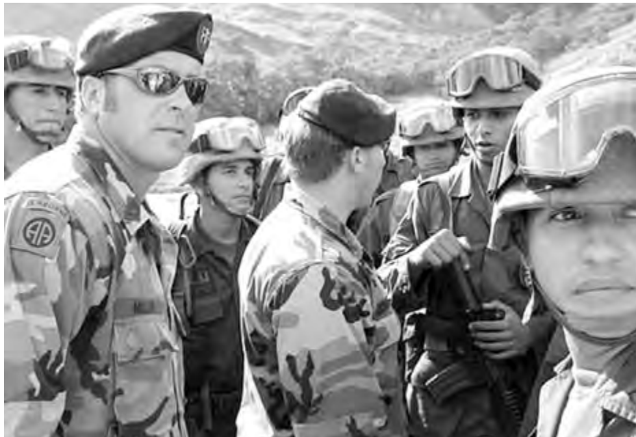
Dos entrenadores de Fuerzas Especiales de EE.UU. con policías antinarcóticos colombianos en San Luis, al oeste de Bogotá, Colombia.

Washington ha encausado y pedido la extradición de por lo menos 10 dirigentes de los escuadrones de la muerte por cargos de narcotráfico. El 24 de noviembre la Corte