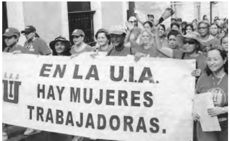
Mujeres miembros de la Unión Independiente Auténtica marchan el 7 de diciembre en San Juan a la mansión de la gobernadora Sila Calderón para denunciar ataques del gobierno contra el sindicato en huelga.

Las negociaciones han continuado y los informes de la prensa afirman que las dos partes han resuelto varios aspectos del convenio. El conflicto principal ha sido en torno al seguro médico, que está pagado por la compañía pero administrado por el sindicato. Cuando una auditoría estatal alegó que la unión había manejado mal