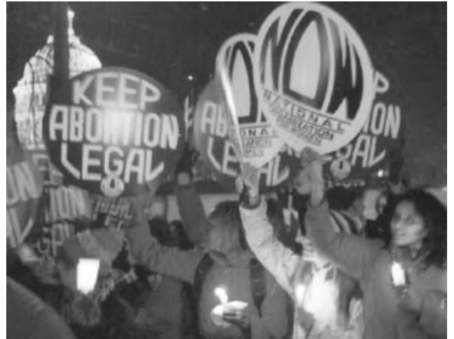
GLOVA SCOTT • PERSPECTIVA MUNDIAL

Hace varios años que tanto demócratas como republicanos comenzaron a intensificar sus ataques contra este derecho. La Enmienda Hyde,