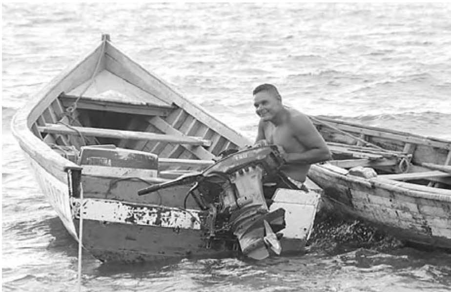
ARGIRIS MALAPANIS•PERSPECTIVA MUNDIAL

Pescador en el distrito de San Carlos en Cumaná, Venezuela, prepara su embarcación para salir a la pesca.