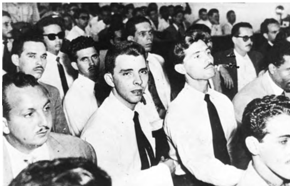
Frank País (de cara a la cámara) durante juicio por participar en el levantamiento del 30 de noviembre de 1956 en Santiago de Cuba.