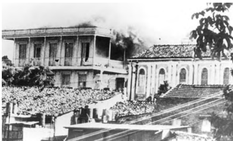
Cuartel de policía en Santiago de Cuba en llamas tras el ataque rebelde del 30 de noviembre de 1956.