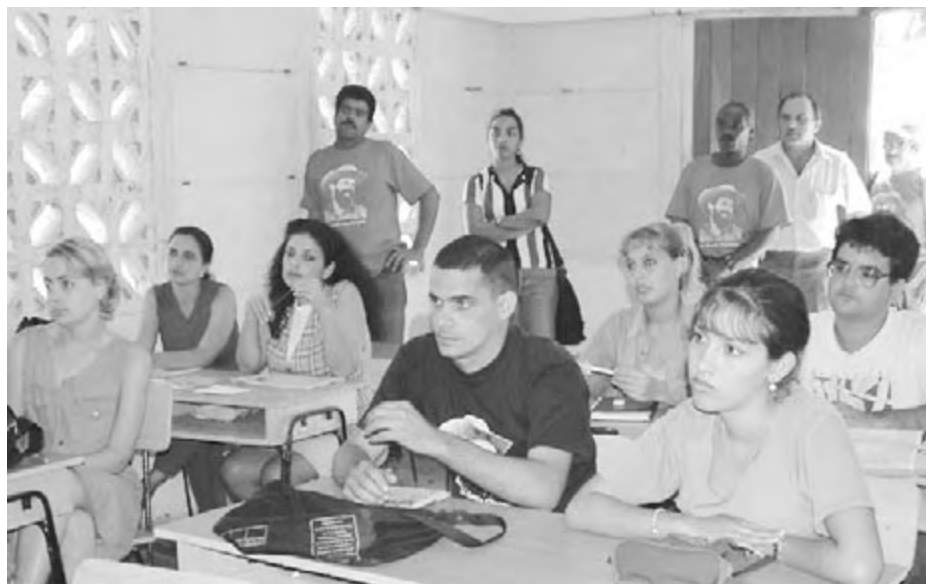
PERSPECTIVA MUNDIAL • JONATHAN SILBERMAN

Trabajadores asisten a clase en febrero de 2003 en la escuela en el complejo azucarero Camilo Cienfuegos, Santa Cruz del Norte, provincia de la Habana, donde trabajaron hasta que cerró el central como parte de la reorganización de la industria azucarera cubana. Unos 100 mil ex obreros azucareros en Cuba están recibiendo sus salarios anteriores mientras siguen cursos de superación y capacitación.