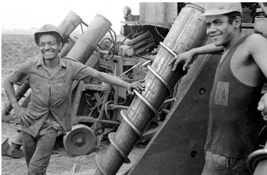
PERSPECTIVA MUNDIAL • ARGIRIS MALAPANIS

Operadores de combinada en la cooperativa cañera Siguatey, provincia de Cienfuegos, abril de 1997. A fines de 1993 las granjas estatales fueron reorganizadas como cooperativas más pequeñas, las Unidades Básicas de Producción Cooperativa. El objetivo era dar a los productores más poder de decisión, aumentar la eficiencia y eliminar grandes números de trabajadores no productivos en las granjas estatales.