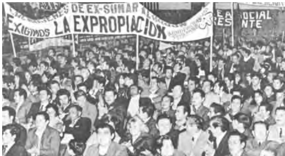
Asamblea obrera en Chile. Las demandas de nacionalización y control obrero de la producción aumentaron a principios de los 70 ante el sabotage patronal. El gobierno de Unidad Popular intentó moderar las demandas obreras, al tiempo que defendió los intereses de propiedad burgueses.

La victoria de Allende reflejó una amplia radicalización de las masas chilenas. Comités de la Unidad Popular surgieron por todo el país para trabajar en la campaña de Allende, y cuando estuvo claro que Allende