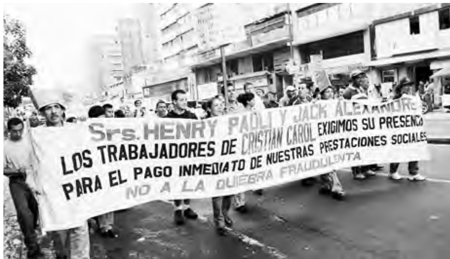
ARGIRIS MALAPANIS • PERSPECTIVA MUNDIAL

Unos 200 obreros de Industrial de Perfumes, fábrica de cosméticos en Caracas ocupada por los trabajadores, marchan al palacio presidencial el 1 de octubre para exigir que el gobierno obligue a los patrones a que paguen los salarios y beneficios atrasados o que nacionalice la planta y permita que los obreros reanuden la producción.