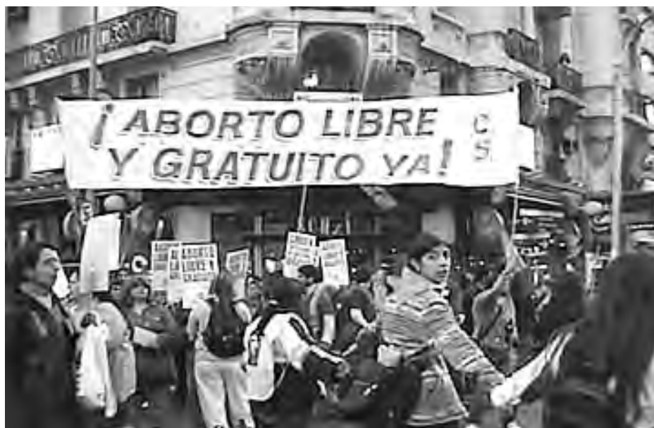
Marcha de 8 mil en Buenos Aires el 26 de septiembre para exigir legalización del aborto. Cuba es el único país latinoamericano donde el aborto es legal.

La marcha aglutinó a mujeres profesionales, trabajadoras y estudiantes. “Estoy por el aborto legal porque son las pobres las que mueren. Yo vi morir a muchas”, dijo al diario Clarín una manifestante de 90