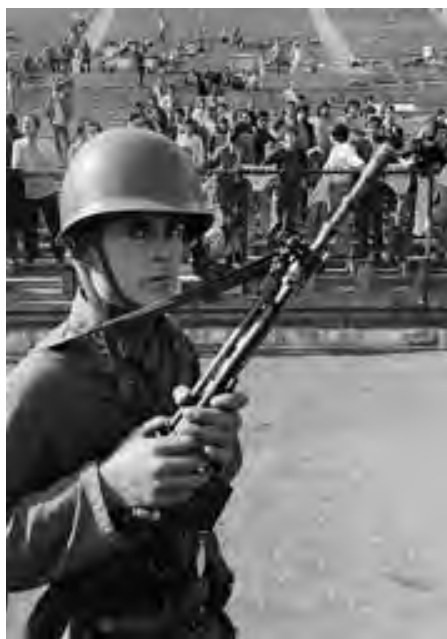
Soldado chileno vigila a partidarios de Allende detenidos tras el golpe militar de septiembre de 1973.

El sabotaje económico fue una de las armas más eficaces usadas por los capitalistas estadounidenses y chilenos contra el gobierno de la UP. Al socavar la economía y reducir el nivel de vida de las masas, buscaban desmoralizar a los trabajadores y poner a la clase media en contra del gobierno.