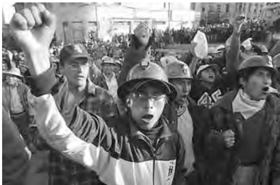
Miles de mineros bolivianos celebran en La Paz el 17 de octubre ante renuncia del presidente Gonzalo Sánchez de Lozada.

Mientras los magnates de las industrias energéticas han acumulado jugosas ga-