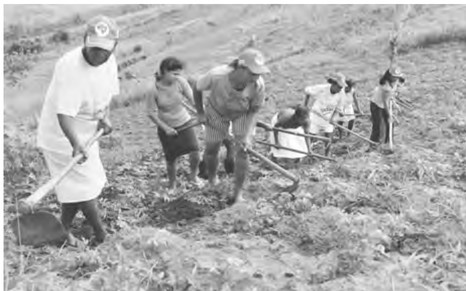
Integrantes del campamento Celina, fundado por mujeres en tierras ocupadas en el estado noreste de Pernambuco, Brasil.

La caída vertiginosa continuó en 2002. El real, la moneda brasileña, bajó en un 35 por ciento y la inflación se disparó. El gobierno de Fernando Enrique Cardoso recibió un