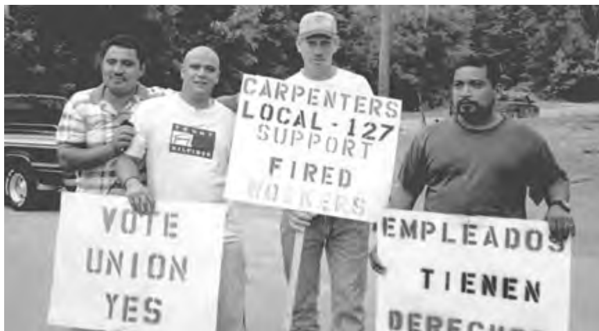
JEANNE FITZMAURICE • PERSPECTIVA MUNDIAL

Piquetes de carpinteros, reivindicando un sindicato, protestan frente a las oficinas de Concrete Form Walls, un contratista en Birmingham, Alabama. La empresa se niega a reconocer la victoria sindical alegando que los trabajadores indocumentados que participaron en las elecciones no tenían derecho a votar.