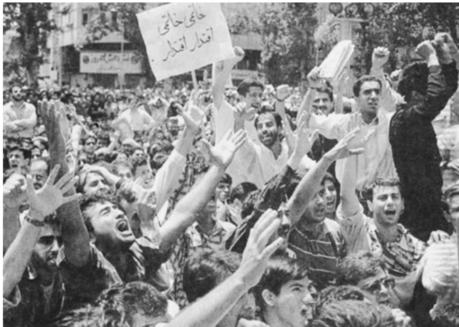
Estudiantes protestan el 10 de julio en Teherán después de haber sido agredidos por las fuerzas de seguridad del gobierno iraní.

La radio y televisión nacionales no divulgaron el ataque contra los estudiantes de Teherán pero, al propagarse la noticia por otros medios, estudiantes en diversas