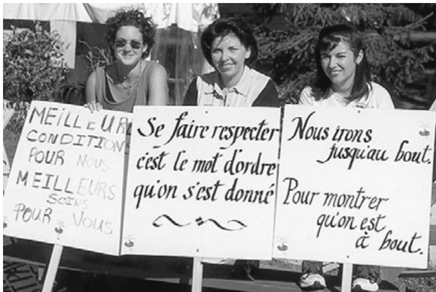
GRANT HARGRAVE-PERSPECTIVA MUNDIAL

Enfermeras en huelga en Montreal el 22 de julio. Las enfermeras en Quebec rechazaron una propuesta de alza salarial del 5 por ciento en tres años, exigiendo un aumento del 10 por ciento. Sin embargo el consejo federal de su sindicato decidió suspender la huelga, que el gobierno de Quebec había declarado ilegal. Las pancartas destacan demandas de respeto y mejores condiciones.