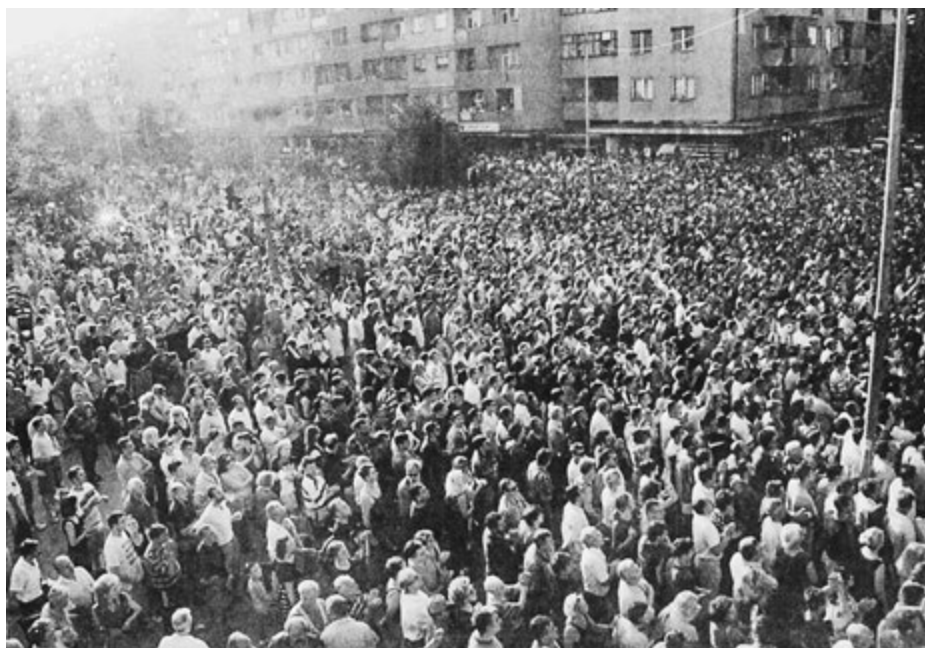
Unas 20 mil personas, incluidos soldados serbios, se manifiestan el 5 de julio en Leskovac exigiendo pago de sus salarios y dimisión del presidente Slobodan Milosevic. Coreaban '¡Ladrones, ladrones!' y '¡Cambios, cambios!' Fue una de las mayores protestas recientes.

deo de Yugoslavia. Es tan criminal como Milosevic: la OTAN mató a trabajadores con sus bombas en Yugoslavia, y Milosevic mató a albaneses en Kosova”.