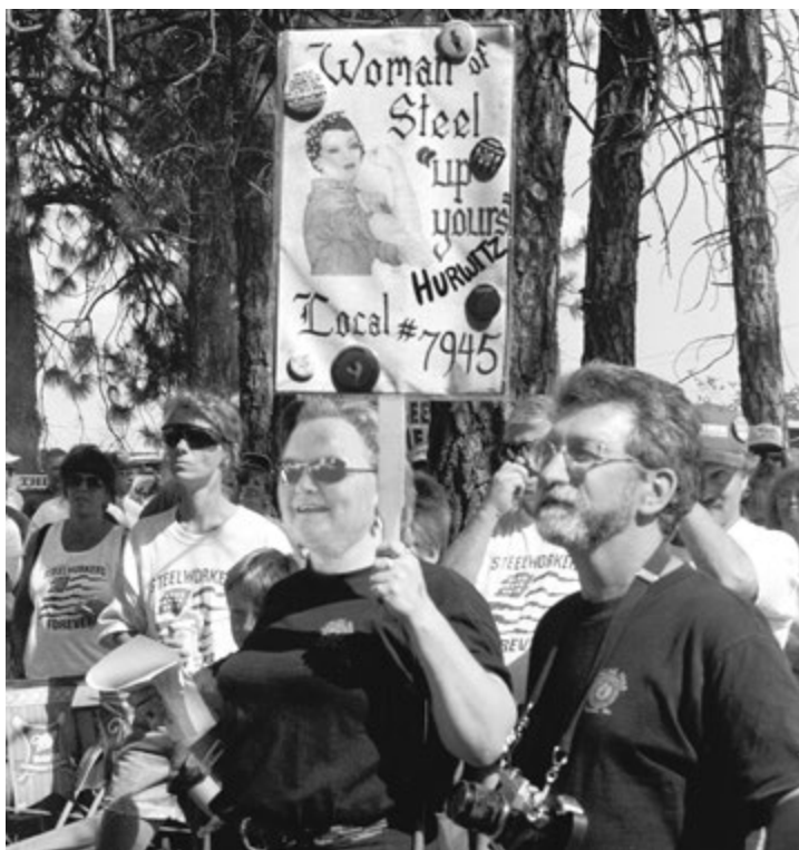
SCOTT BREEN-PERSPECTIVA MUNDIAL

Gilliam y Ernest habían llegado en autobús con un grupo de obreros del acero de la planta de la Kaiser en Tacoma, Washington, a cinco horas de distancia. También llegó en autobús un grupo de obreros de la empresa Reynolds Aluminum en Troutdale, Oregon, quienes trajeron una donación de 2 500 dólares.