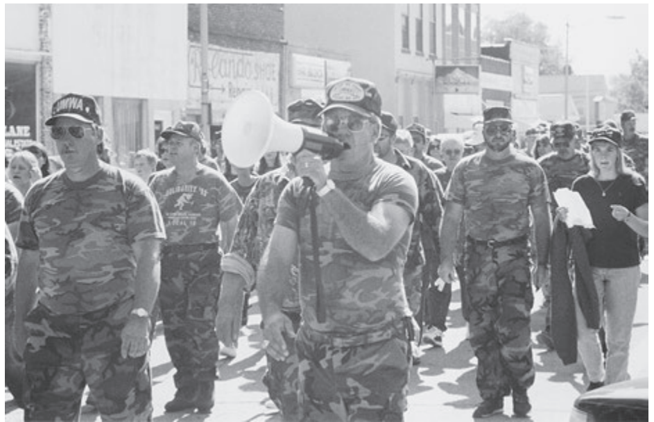
JIM GARRISON • PERSPECTIVA MUNDIAL

Durante los próximos tres meses, al vincularse con otros trabajadores y agricultores en pie de lucha, las ramas del PST organizarán un periodo de discusión previa al congreso basándose en documentos del partido. Las resoluciones y los informes estratégicos debatidos y adoptados por los