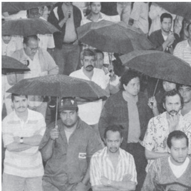
Obreros de la Ford, que cesantó a casi 3 mil automotrices en São Bernardo do Campo en diciembre, exigen su restitución el 15 de enero.

El desempleo asciende al 7.3 por ciento en Brasil, y al 19 por ciento en el centro industrial de São Paulo. Desde el 5 de enero, casi 3 mil obreros despedidos de la Ford en São Bernardo, cerca de São Paulo, han regresado a sus puestos exigiendo su restitución; la compañía no los ha podido echar. Mientras tanto, los trabajadores rurales sin tierra continúan sus tomas de tierras. ■