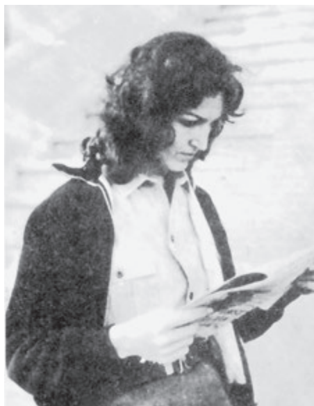
Haydée Tamara Bunke (Tania)

En la ceremonia de octubre de 1997 en honor a Che Guevara y sus compañeros, el presidente de Cuba Fidel Castro dijo, “Veo a Che y a sus hombres como un refuerzo, como un destacamento de combatientes invencibles, que esta vez incluye no sólo cu-