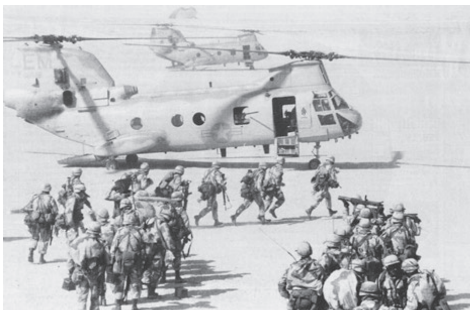
Marines norteamericanos a punto de montar en helicóptero durante la matanza del pueblo iraquí en 1990-91.

Para apretar su cerco militar alrededor del estado obrero ruso, Washington ha lanzado un Programa de Equipo Conjunto de