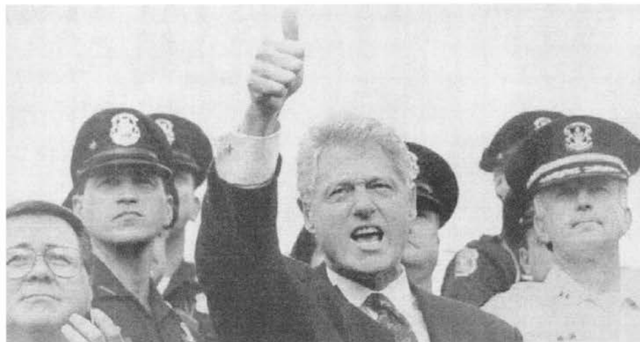
Clinton hace campaña en Michigan. 'El policía nunca tuvo mejor amigo en la Casa Blanca que Clinton', dijo el presidente de la Orden Fraternal de Policias, que anunció su respaldo a la reelección del presidente.

En los dos últimos meses de la contienda presidencial, los dos principales partidos burgueses se encuentran en el proceso de redefinir los ejes políticos de su imagen.