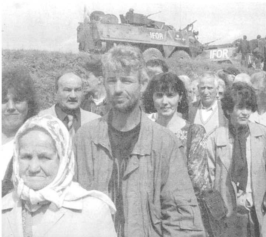
Tropas de ocupación de la OTAN patrullan el pueblo bosnio de Doboí mientras musulmanes hacen cola para votar el 14 de septiembre.

La fuerza de la OTAN, que incluye 20 mil soldados norteamericanos, debe iniciar su retirada el 20 de diciembre. Sin embar-