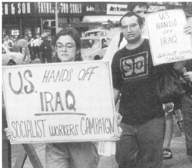
MARGRETHE SIEM • PERSPECTIVA MUNDIAL