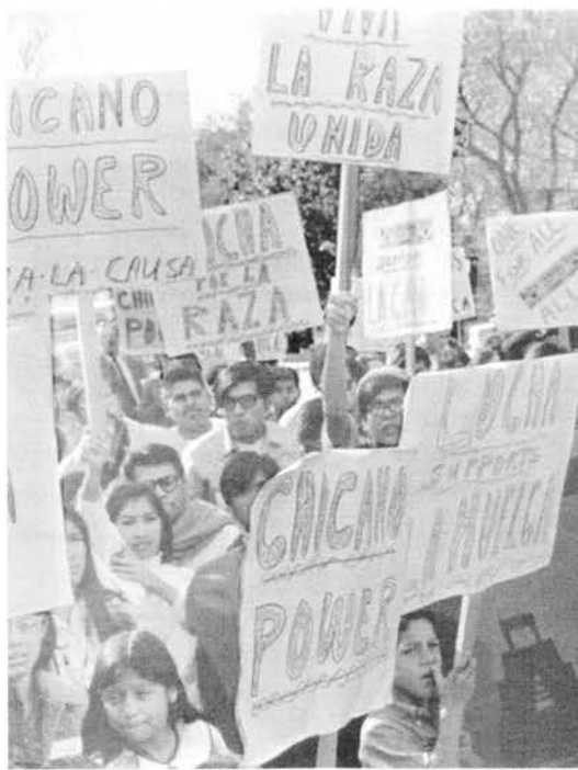
Chicanos en Austin, Texas, apoyan a huelguistas de Economy Furniture en noviembre de 1969. Estas y otras luchas llevaron a la creación del Partido de la Raza Unida en Texas y otros estados.

Si bien el movimiento chicano se inspiró en parte en el movimiento negro, cabe señalar varias diferencias importantes: