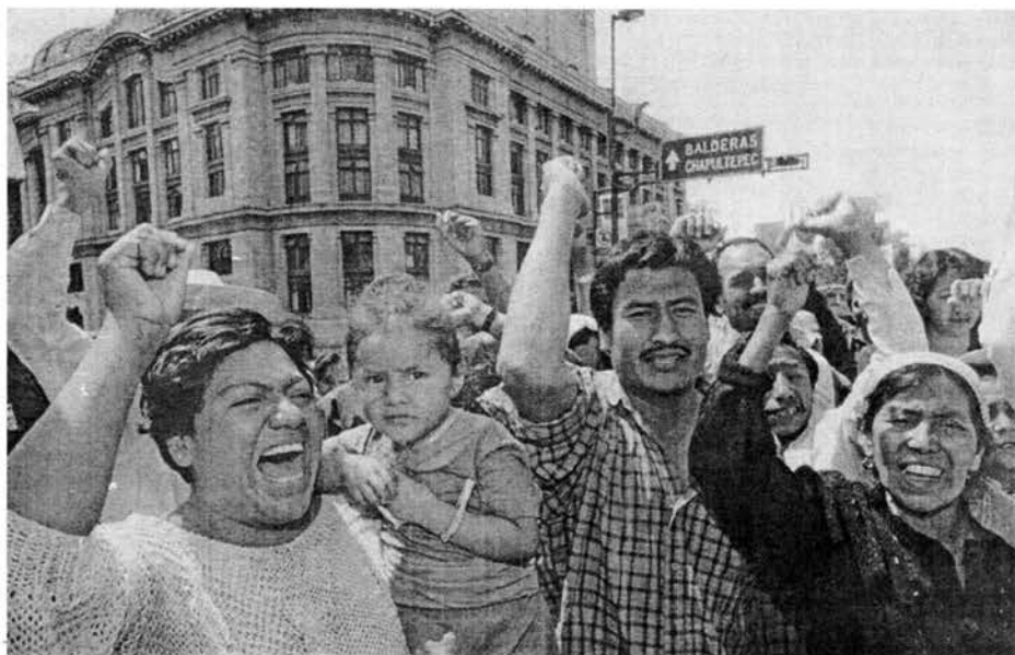
Familiares de campesinos asesinados el 18 de junio de 1995 por la policía estatal de Guerrero protestan frente al senado mexicano.

El manifiesto del EPR aboga por derrocar al actual régimen y sustituirlo con un gobierno revolucionario que llevaría a cabo una serie de medidas. Entre éstas están: la renegociación de la enorme deuda externa