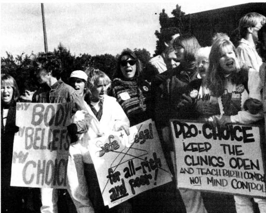
Dennis Chambers/Perspectiva Mundial

Aunque la decisión de la Corte Suprema codifica los avances que ha logrado hasta ahora esta ofensiva contra los derechos de la mujer, al mismo tiempo fue una fuerte reprimenda para la administración Bush y grupos antiaborto como Operación Rescate. Ante todo, el fallo representó una decisión política que tuvo en cuenta el hecho de que no se puede resolver el asunto simplemente con una decla-