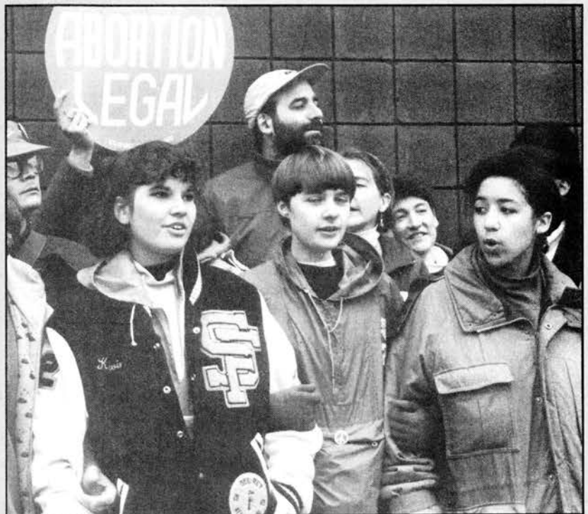
Haciendo guardia frente a una clínica de aborto en Buffalo