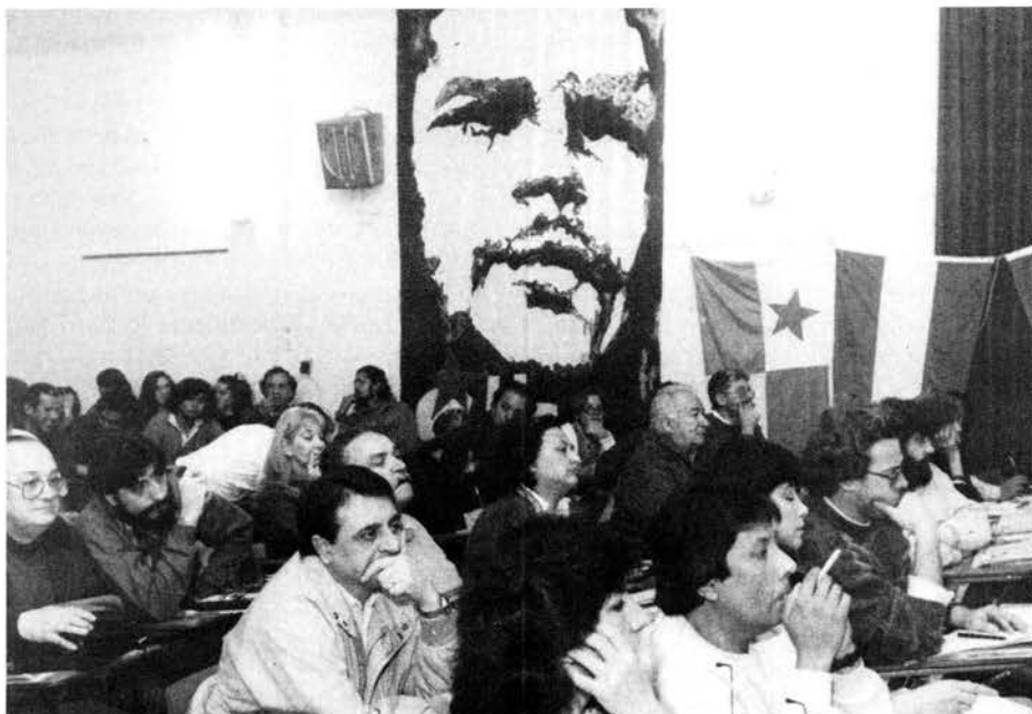
Unos 300 delegados participaron en el encuentro en Argentina, que se tituló: 'Debates y búsquedas actuales para la construcción de una alternativa política revolucionaria en América Latina y el Caribe: homenaje a Ernesto Che Guevara'.

Además del Partido Comunista de Cuba, los únicos grupos del Caribe que enviaron delegados fueron el movimiento Lavalas de Haití y el Partido Comunista Dominicano, cuyo delegado también representaba la Unidad Caa-