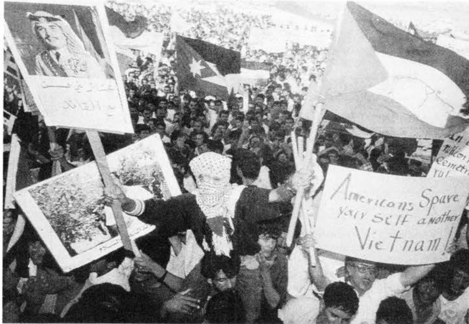
"Norteamericanos ahórrense otro Vietnam". Palestinos en Jordania se manifiestan contra las maniobras de guerra de Estados Unidos. Las amenazas contra Irak han desatado protestas masivas de parte de los pueblos árabes.

En 1979, el pueblo iraní derrocó la monarquía de los Pahlevi por medio de una masiva movilización revolucionaria despedazando un pilar central para la estabilidad imperialista. Las monarquías saudita y kuwaití se volvieron más importantes aún para los imperialistas.