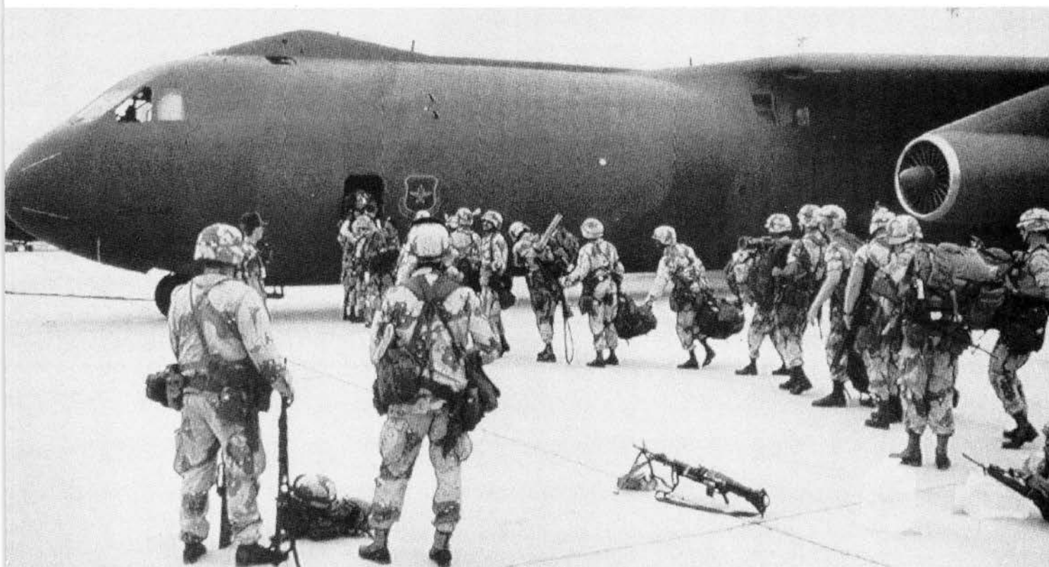
Soldados norteamericanos se preparan para partir hacia Arabia Saudita.