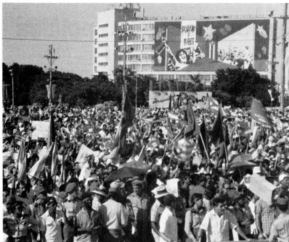
Rich Stuart/Perspectiva Mundial