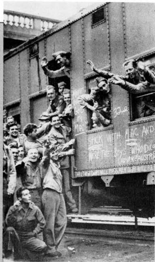
“Quédate con Mac (general Douglas MacArthur 41 y 32 divisiones del ejército norteamericano e tras la segunda guerra mundial porque las tropas

La reunión cumbre de junio entre el presidente norteamericano George Bush y el presidente soviético Mijaíl Gorbachov fue un ejemplo de ello. Gorbachov estuvo en Estados