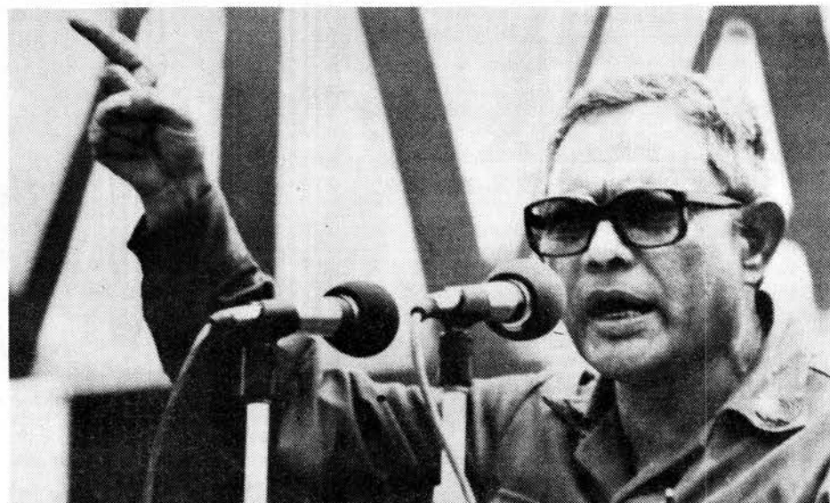
Comandante de la Revolución Tomás Borge el primero de mayo en Managua.

Cuando pasábamos por el parque que la revolución construyó, con el corazón lleno de ternura, recordábamos que un dos de mayo murió ese niño que pasará a la posteridad como un verdadero héroe de la revolución, Luis Alfonso Velásquez. Recordábamos que durante el mes de mayo,