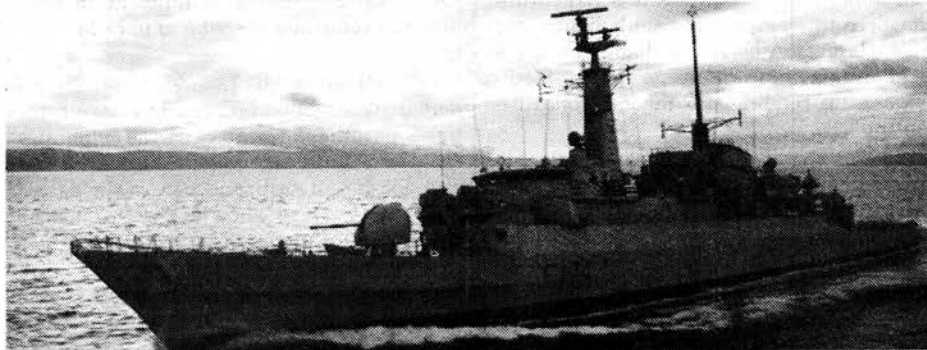
La fragata H.M.S. Alacrity, patrullando el Atlántico Sur.

• La base norteamericana en la isla de Ascensión le está sirviendo a Gran Bretaña como punto de concentración, entrenamiento y suministro a la armada británica. Los aviones tanqueros de Gran Bretaña y los bombarderos estratégicos Vulcan, que han realizado varios ataques