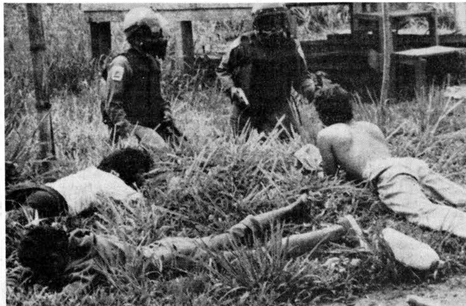
Pistola en mano, con máscara antigases y chalecos contra balas los policías someten a rescatadores indefensos.

Gobierno colonial desahucia comunidad de rescatadores