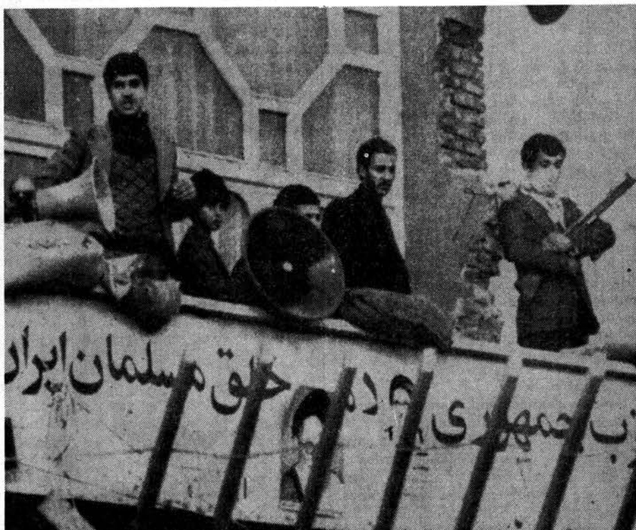
Militantes del Partido Islámico Republicano del Pueblo Musulmán en su local en Tabriz.

Con el alza acelerada de la inflación, se desataron grandes protestas contra los altos precios de los artículos de primera