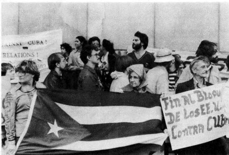
Manifestación de solidaridad con Cuba en Nueva York.

Una de las ideas planteadas en la plataforma de la Brigada para el Diálogo y mencionada en el "Acta Final" ya ha sido implementada, la de enviar a niños cubanos del exterior a los campamentos de los pioneros para compartir esa experiencia