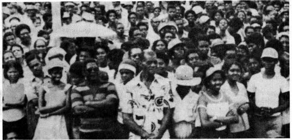
Actos masivos como este en Seamount, que atrajo a 10 000 personas, señalaron el fin del régimen de Gairy.

Una vez que la rebelión fue aplastada, los británicos importaron más esclavos e