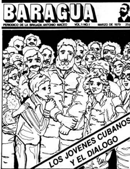
Portada de 'Baragua', periódico de la Brigada Antonio Maceo.

invasión de ese país por tropas somalíes. Después vino la acusación contra Cuba de que había patrocinado la rebelión de Katanga en Zaire. Cuba rechazó esta acusación tajantemente y Estados Unidos se vio forzada a retirarla.