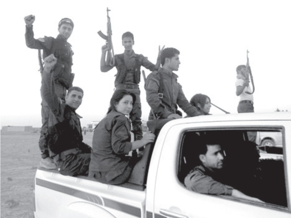
Combatientes kurdos rumbo al frente de batalla en Kobani, Siria, el 18 de octubre para combatir al Estado Islámico, y forzarlos a abandonar algunas de sus posiciones.

Cuando los vencedores imperialistas de la Primera Guerra Mundial se repartieron el Medio Oriente, le negaron una patria al pueblo kurdo. Hoy día esta nacionalidad oprimida cuenta con alrededor de 30 millones de personas en una región que abarca partes de Turquía, Siria, Iraq e Irán. Su lucha de décadas ha abierto espacio para los trabajadores y las mujeres de la región, un hecho que es evidente por la importante proporción de combatientes kurdos que son mujeres.