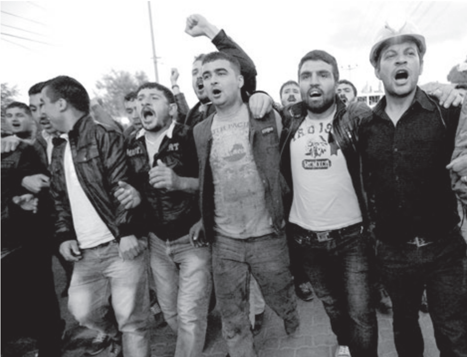
Mineros del carbón protestan en Kinik, Turquía, tras desastre en mina cerca de Soma, el 13 de mayo, que mató a más de 300 mineros, incluyendo a más de 50 del área de Kinik. La mina ha permanecido cerrada mientras los trabajadores luchan por seguridad en el trabajo y mejoras.

“Esta apelación forma parte de una lucha más amplia en la cual el Militante se ha unido a otras publicaciones y organizaciones para defender los derechos de libre expresión de los presos y de la prensa”, dijo Nelson. “Cuando