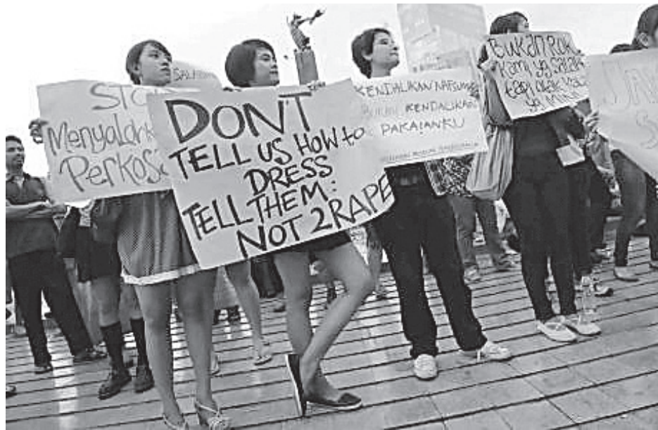
Protesta en Jakarta, Indonesia, septiembre de 2011, contra los comentarios del gobernador que las mujeres violadas en el transporte público tenían la culpa por vestirse con minifaldas.

Waters dijo a los trabajadores de la carne que su resistencia no era solo para ellos. Dijo que su lucha aquí ha captado la atención de los trabajado-