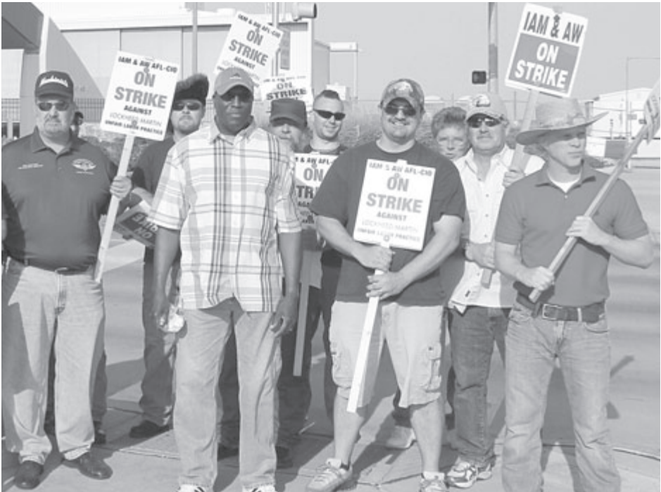
Huelguistas en Lockheed Martin en Fort Worth, Texas, 29 de abril. Seis días antes 3 600 obreros se fueron en huelga en contra de ataques al seguro médico y pensiones de nuevos empleados.