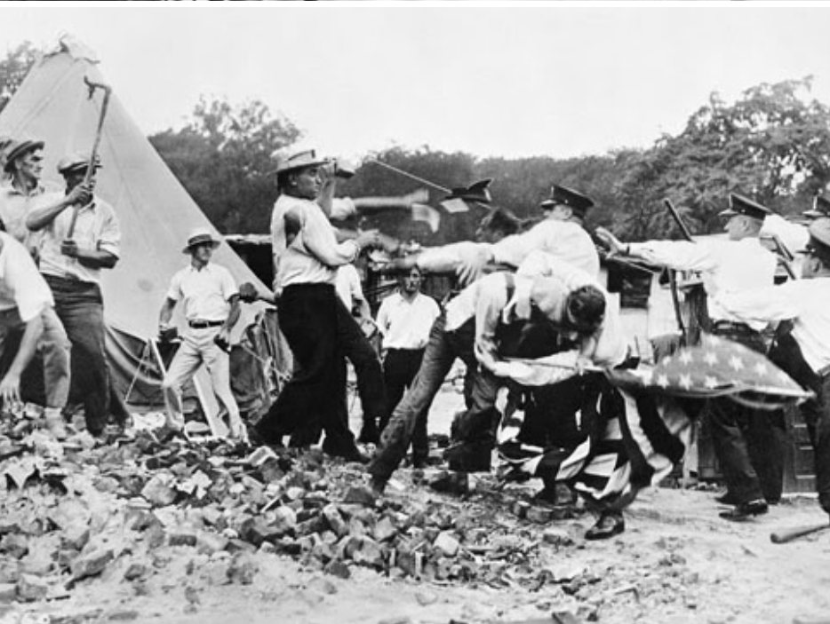
Arriba: Colectores de basura en Memphis, Tennessee, 29 de marzo de 1968, durante huelga contra discriminación racista y por mejores condiciones de trabajo. Debajo: Algunos de los 20 mil desocupados veteranos de la Primera Guerra Mundial, acampados cerca del Capitolio en Washington en 1932 se defienden de un asalto policiaco. Una de las conquistas más importantes de la luchas por los derechos de los negros en los años 50 y 60 fue la ampliación del salario social como producto derivado de las batallas que forjaron los sindicatos industriales.

movimiento social y político de la clase trabajadora, de carácter masivo, para extender estas conquistas a todos como derechos universales , no como beneficencia que se otorga solo a los que pueden probar que la necesitan. Con nues-