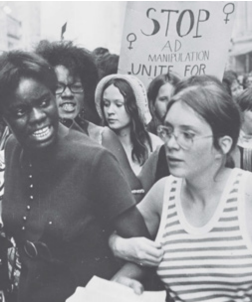
Unas 30 mil personas marcharon en la ciudad de Nueva York el 26 de agosto de 1970, en apoyo a los derechos de la mujer.

Durante la expansión masiva del capitalismo durante el boom económico de la posguerra, los aparatos domésticos modernos, la comida congelada y empaquetada, la disponibilidad de ropa confeccionada, y otras creaciones transfirieron muchas tareas domesticas de la unidad familiar individual a la producción social e industrial. Al mismo tiempo, más mujeres que nunca comenzaron a trabajar fuera del hogar—de un 34 por ciento en 1950 a más del 43 por ciento en 1971.