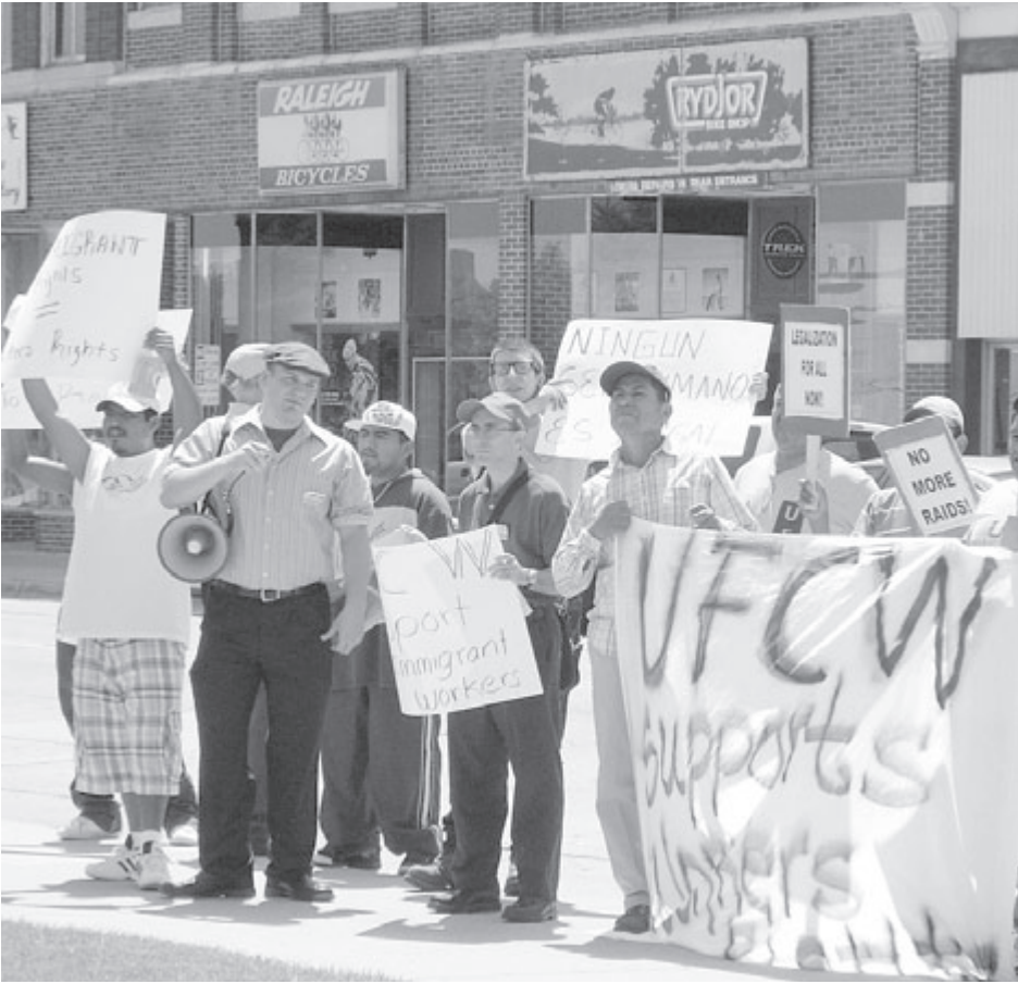
Manifestación en Austin, Minnesota, el 11 de julio en apoyo a los derechos de los trabajadores inmigrantes y en contra del movimiento de los Nazis.

Para conseguir votos de la minoría hazara, Karzai trajo a su campaña a dos caudillos hazara con historiales