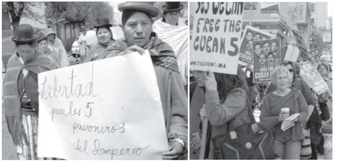
Manifestaciones en apoyo a los Cinco Cubanos. Izquierda, mujeres indígenas en Bolivia frente a la embajada estadounidense en La Paz, Bolivia, el 12 de septiembre de 2007. Derecha, en San Francisco, el 15 de junio después que la Corte Suprema se negó a revisar su apelación.

Los representantes de la industria farmacéutica anunciaron que habían llegado a un acuerdo con la Casa Blanca en