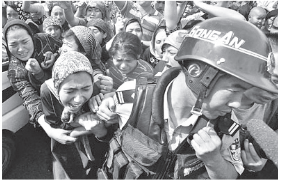
Parientes de uigures arrestados por la policía china protestan el 7 de julio en Urumqi, capital de la provincia de Xinjiang. La opresión nacional de los uigures por el gobierno estalinista, dominado por chinos han, es la raíz del actual conflicto que ha quitado la vida a 184 personas.

En la provincia de Xinjiang se construyó una autopista y un ferrocarril, e instaron a millones de chinos han, incluyendo a muchos trabajadores y agricultores, a que fueran “al