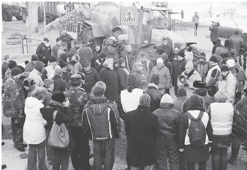
Agricultores bloquean entrada al Ministerio de Agricultura en Riga, Letonia, el 3 de febrero. El colapso del gobierno en ese país es otra consecuencia de la crisis capitalista internacional que está afectando a trabajadores de todo el mundo, según destacó Mary-Alice Waters.