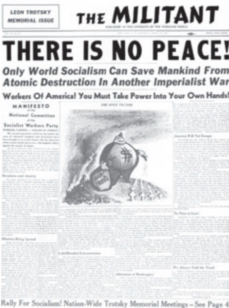
Izquierda: “No hay paz”, explica la edición del 18 de agosto de 1945 del Militante . El Partido Socialista de los Trabajadores hizo campaña en oposición a la guerra imperialista. Derecha, arriba: Manifestación en Nueva York en 1943 en contra de la segregación racial. Derecha, abajo: 18 dirigentes del PST y del Local 544 del sindicato Teamsters en Minneapolis en 1943 antes de ser encarcelados bajo la Ley Smith, la “Ley de la Mordaza”.

los Trabajadores, mantuvo la perspectiva marxista de que en la época moderna no existe un ala progresista de la clase capitalista. Los principales rivales capitalistas industrializados, dominados por el capital financiero—lo que los marxistas llaman el imperialismo—están constantemente impulsados a librar guerras de conquista con las cuales intentan redividir los territorios del mundo. La vanguardia de los trabajadores, sostenía el partido, tiene que explicar el carácter imperialista de la guerra y por-