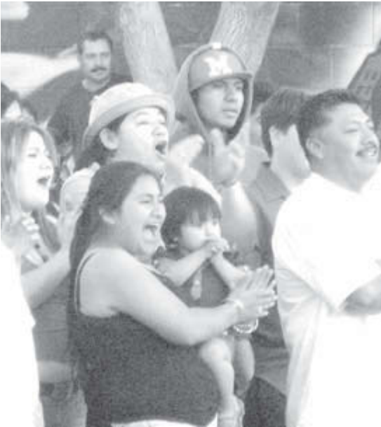
Izquierda, obreros que resisten la deportación y sus partidarios durante evento de lucha libre el 22 de marzo en Van Nuys, California, para recabar fondos. Derecha, “Supermojado”, luchador defensor de los derechos de inmigrantes, derrota al “INS”, policía de inmigración.

Las marchas del 1 de mayo partirán desde el centro de Los Angeles y del Parque MacArthur, donde el año pasado la policía atacó a manifestantes que marchaban pacíficamente. Entre los patrocinadores están la Coalición Pro Derechos Humanos del Inmigrante (CHIRLA), la Coalición 25 de Marzo y la Hermandad Mexicana Nacional.