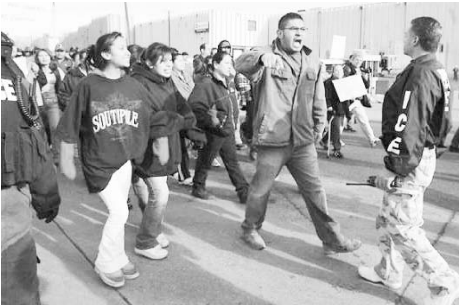
Familiares y partidarios de trabajadores arrestados en redada en planta de la Swift en Greeley, Colorado, enfrentan a agentes de inmigración frente a la fábrica el 12 de diciembre.

Exigen libertad de arrestados, no deportaciones